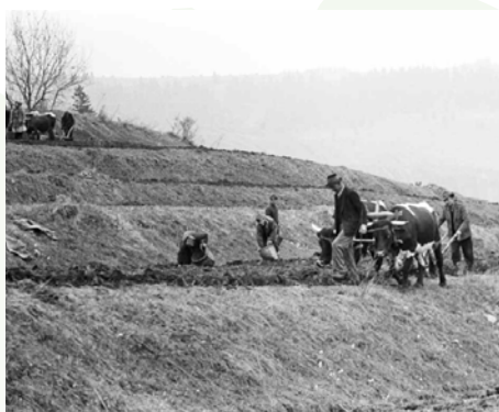
Oranie po vrstevniciach