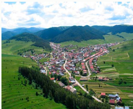
Unikátne terasovité políčka

Výstupom projektu je unikátny vzhľad krajiny, zvýšený počet návštevníkov obce zaujímajúcich sa o krásu krajiny a tradície s ňou súvisiace, udržiavanie a návrat k hospodáreniu na historických krajinných štruktúrach.