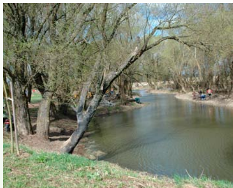
Pohľad z východného brehu