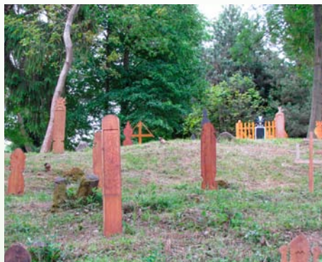
Repliky drevených novohradských náhrobníkov

Výsledkom projektu je nielen obnova cintorína, ktorý sa už pomaly vytrácal z pamäti miestnych obyvateľov, ale aj obnova kultúrnej hodnoty náhrobníkov a symbolického miesta v krajine, čím sa obec Horný Tisovník čoraz viac dostáva do povedomia verejnosti, a to nielen v rámci regiónu. Stáva sa tak východiskovým bodom pre putovanie za ľudovými náhrobníkmi po celej severozápadnej časti Novohradu a zdrojom posilnenia regionálnej identity prostredníctvom tohto unikátneho ľudového výtvarného prejavu.