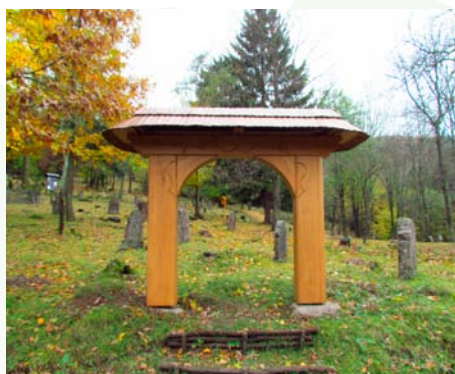
Replika drevenej vstupnej brány do cintorína