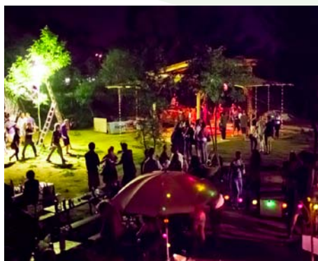
Aktívne využívanie priestoru parku