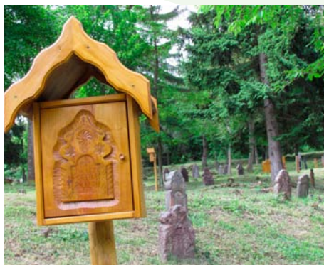
Schránka s informačnými textami

O výnimočnej hodnote tohto miesta i projektu záchrany svedčí ocenenie, ktoré získala obec Horný Tisovník – Cena časopisu Pamiatky a múzeá za rok 2010 .