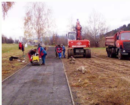
Priebeh prác pri budovaní okruhu