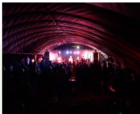
Krytý priestor – hangár