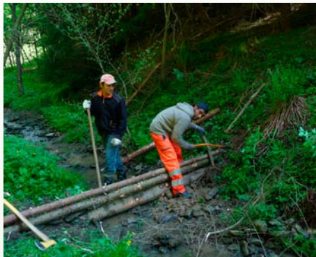
Práce na hrádkach

ich účinnosť. Na poľnohospodárskej a lesnej pôde došlo k zadržaniu vody, čím bola uchránená zastavaná časť obce. Občania a miestne poľnohospodárske družstvo sa o realizáciu prác aktívne zaujímali, ale o význame projektu sa presvedčili najmä po tom, ako vykonané opatrenia uchránili ich majetok.