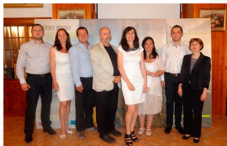
Členovia odbornej komisie

Na oficiálnom vyhlásení tretieho ročníka ceny bol stanovený termín akceptácie prihlášok na 30. 6. 2014. Po jeho uplynutí a po administratívnej kontrole prihlášok (do 14. 7. 2014) národný koordinátor zverejnil nominované projekty, ktoré splnili kritériá ceny. Nominované projekty boli obhajované pred odbornou komisiou zloženou zo zástupcov verejnej správy, akademickej obce a tretieho sektora pôsobiaceho v danej oblasti.