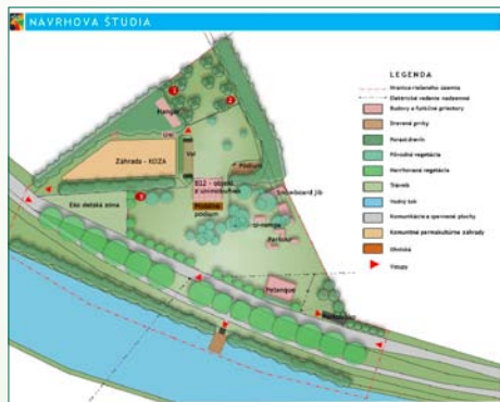
Hidepark – aktuálny stav