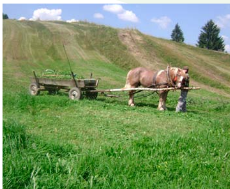
Tradičné obhospodarovanie pôdy

Obec Liptovská Teplička je nositeľkou titulu Dedina roka 2007 a v súťaži o Európsku cenu obnovy dediny v roku 2008 sa umiestnila na 2. mieste. Miestny chotár bol v roku 2007 ohodnotený ako Chotár roka a partner PPD Liptovská Teplička za svoje ekologické poľnohospodárstvo nosí titul Biofarma roka 2013 .