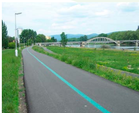
Dokončená prvá etapa

Z plánovaného projektu zostáva ešte dokončiť úseky v časti Lodenica a v katastrálnych územiach okolitých obcí. Partnerom projektu bolo okrem mesta Piešťany i Povodie Váhu OZ Piešťany. Popularita okruhu medziročne neustále narastá, a to aj vďaka ďalším nadväzujúcim aktivitám v trase okruhu. Ročná návštevnosť trasy presahuje 200 000 návštevníkov a v minulosti nie veľmi využívané územie sa stalo jednou z hlavných atraktív územia na trávenie voľného času občanov i návštevníkov mesta Piešťany.