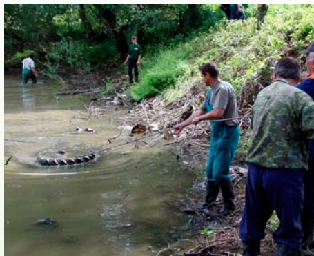
Dobrovoľníci odstraňujú odpad

si pre spoluprácu pri zveľaďovaní priestoru získalo aj ďalšie subjekty – miestnu základnú školu, regionálne združenie obcí Mikroregiónu Hornád, členov rybárskeho zväzu, ale i ďalšie občianske združenia.