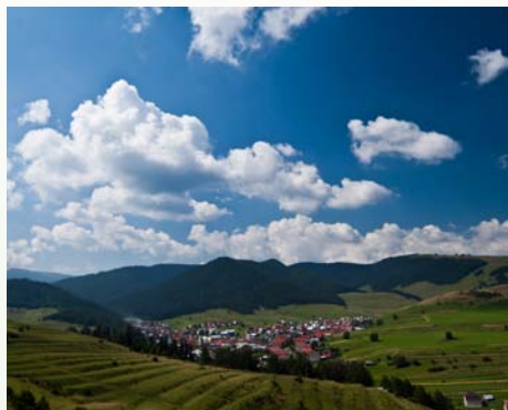
Výnimočná krajina v okolí obce