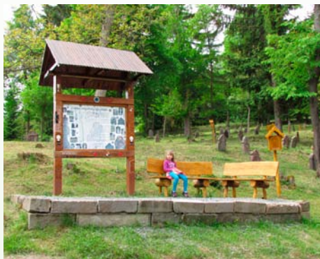
Hlavná informačná tabuľa